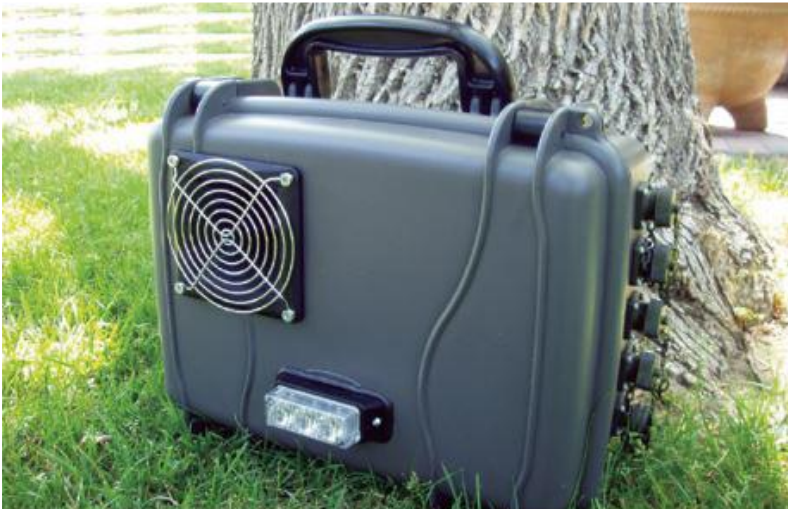
სურათი 3: სრულად პროგრამირებადი სინათლისა და ხმის მოწყობილობა

ღღეისათვის ფართოდაა დანერგილი სრულად პროგრამირებადი სინათლის და ხმის მოწყობილობა, რომელიც შეიძლება დამაგრდეს ღობეზე ან ხეზე სამოვრის ტერიტორიაზე გარეული ცხოველების შემოჭრის თავიდან ასაცილებლად (იხ. სურათი 3). მოწყობილობამ