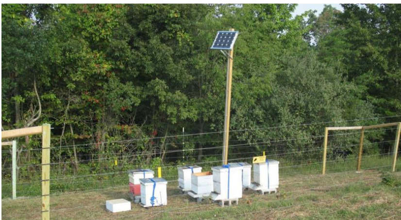
სურათი 2: მზის ენერგიაზე მომუშავე ელექტრო ღობე

დღეისათვის ყველაზე ეფექტურ პრევენციულ საშუალებად ითვლება „ელექტრო მწყემსი“ (electric fencing). იგი მოქმედებს როგორც წვრილ, ისე მსხვილ გარეულ ცხოველებზე, მაგ. როგორცაა მურა დათვი, მგელი. შინაური პირუტყვი ერიდება მასთან კონტაქტს, რაც ასევე ერთ-ერთი მნიშვნელოვანი ფაქტორია საქონლის უსაფრთხოების უზრუნველსაყოფად. ელექტრომწყემსი გამოიყენება როგორც პირუტყვის დამისათევი (თავშეყრის) ადგილების დასაცავად, ასევე საძოვრებზე, საძოვრის დიდი ფართობის შემოსაფარგლად. ელექტრომწყემსი ასევე ეფექტურად გამოიყენება ფუტკრის სკების და სასოფლო სამეურნეო სავარგულების დასაცავად (იხ. სურათი 2). ელექტრომწყემსის დადებითი მახასიათებელია მისი ხანგრძლივი ექსპლუატაციის შესაძლებლობა. უარყოფით მახასიათებლად ითვლება პირველადი ინსტალაციის ღირებულება (ტექნიკური მახასიათებლიდან გამომდინარე