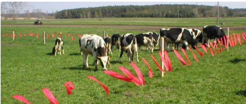
სურათი 1: დროშებიანი ბარიერი

მგლებისგან შინაური პირუტყვის დასაცავად აღმოსავლეთ ევროპაში და რუსეთში გამოიყენება დროშებიანი ბარიერი. ბარიერი მარტივი კონსტრუქციისაა, ის შედგება თოკზე დაკიდებული მოქანავე დროშებისგან, დროშებს შორის დაშორებაა 0.5 მეტრი (იხ. სურათი 1). კვლევებმა აჩვენა, რომ მგლებს ეშინიათ თოკზე დამაგრებული მოქანავე დროშების და არ კვეთენ ასეთ ბარიერებს. მსგავსი ბარიერებით დღესაც იცავენ შინაურ პირუტყვის. ასეთი ბარიერის მოწყობა ადვილია შინაური პირუტყვის ღამისათვე ადგილას, მაგრამ რთულია სამოვრებზე გამოყენება. აღსანიშნავია, რომ ამ ბარიერის არ ეშინია დათვს. შინაური პირუტყვი არ უფრთხის ამ ბარიერს და ადვილად ტოვებს მას. როგორც